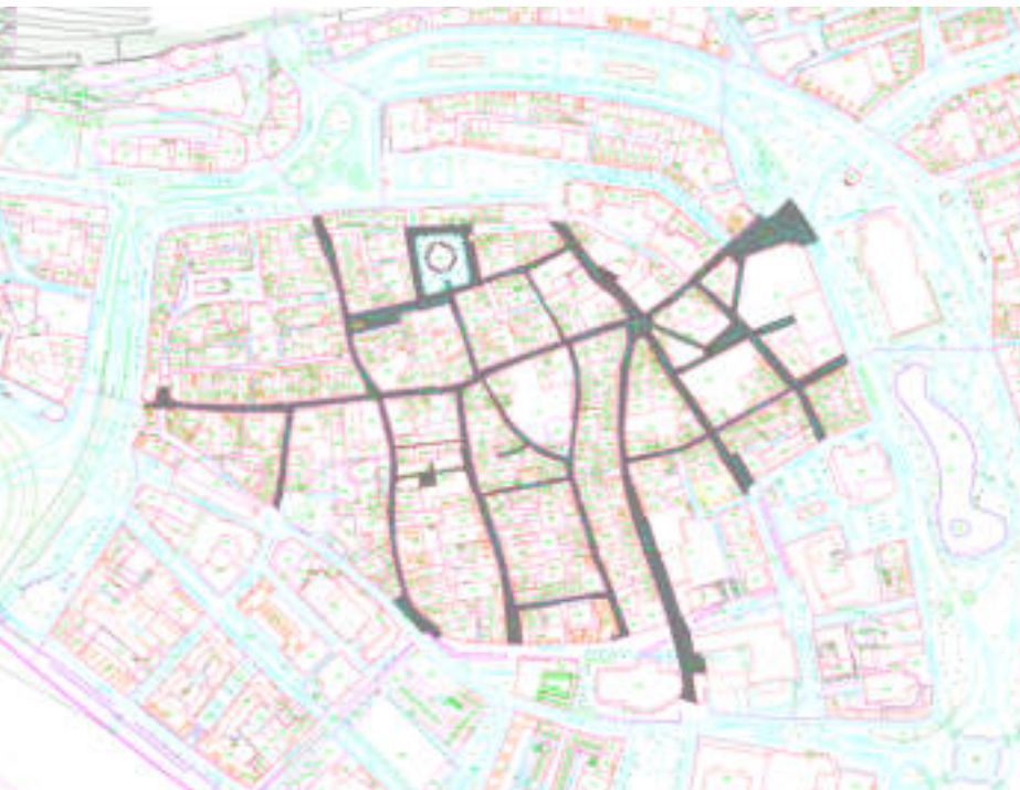
Afbakening BIZ Arnhem